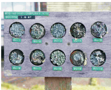
Bioindikation mittels Flechten