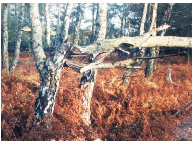
Renaturierung "Ribnitzer Großes Moor"